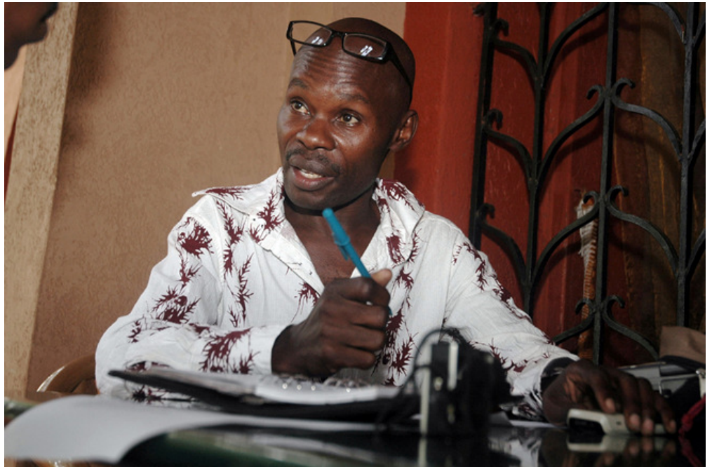
[2F] 31 décembre 2009 - Photographie de David Kato (AP) http://www.hrw.org/sites/default/files/media/images/photographs/2009_Uganda_Kato.jpg http://www.tjenbered.fr/visuels/kato_ouganda_ap_2009.jpg