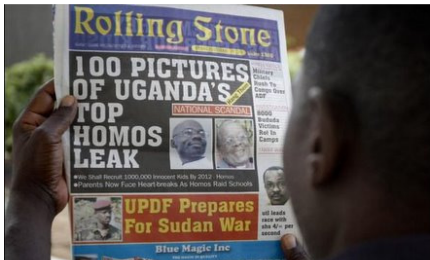
[2E] 9 octobre 2010 - 100 Pictures of Uganda's Top Homos Leak (Rolling Stone) http://yagg.com/2010/10/22/ouganda-un-journal-oute-100-gays-et-invite-a-les-pendre/ http://www.tjenbered.fr/visuels/rolling_stone_ouganda_20101009.jpg