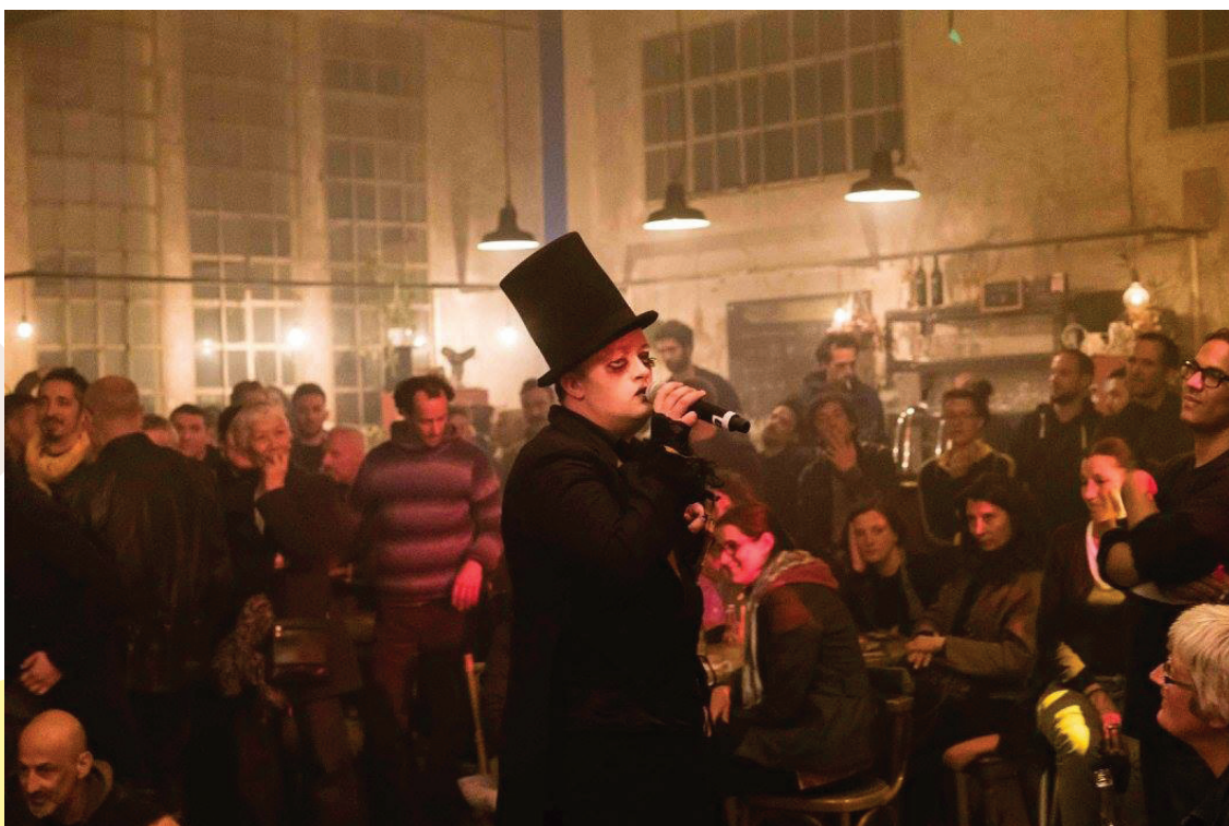
Monsieur K – LE BAL DES ILLUSIONS