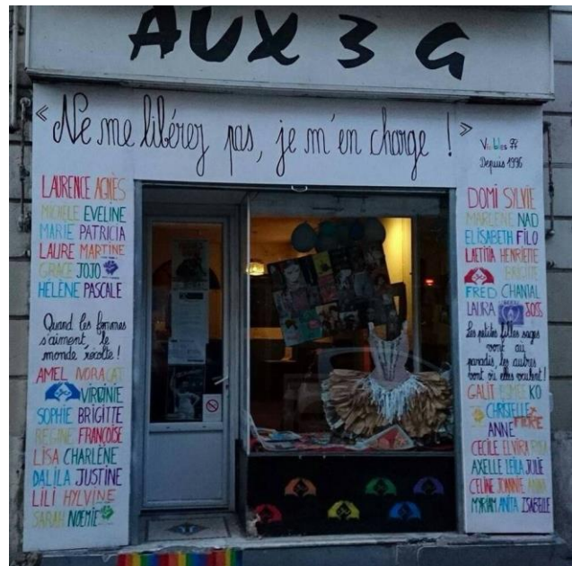
La devanture 2016 qui rend hommage aux femmes qui font ce lieu depuis 20 ans