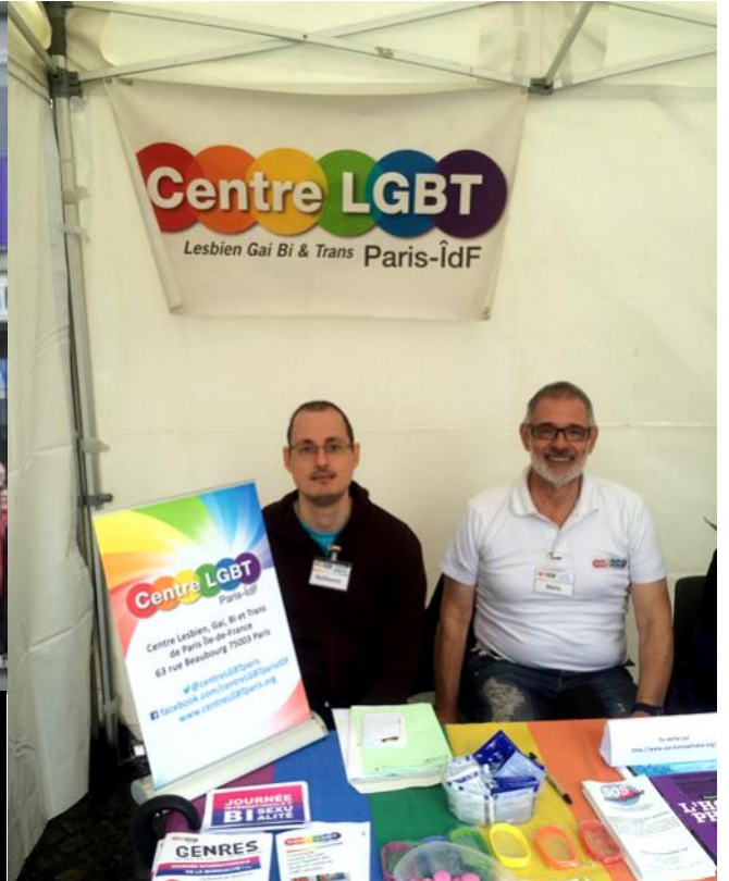
FORUM DU 19ÈME