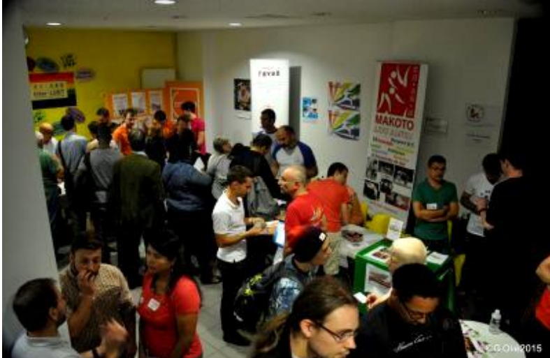
RENTRÉE DES ASSOCS