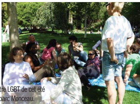
Un des pique-niques du Centre LGBT de cet été qui s'achève : le 15 août au parc Monceau.