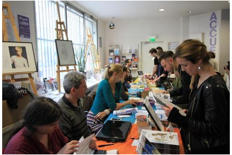
Salon de la la BD et illustration LGBT en juin