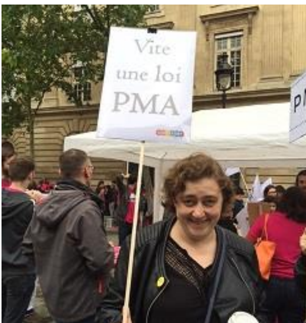
Manifestation pour la PMA