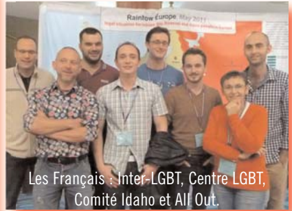
Les Français : Inter-LGBT, Centre LGBT, Comité Idaho et All Out.