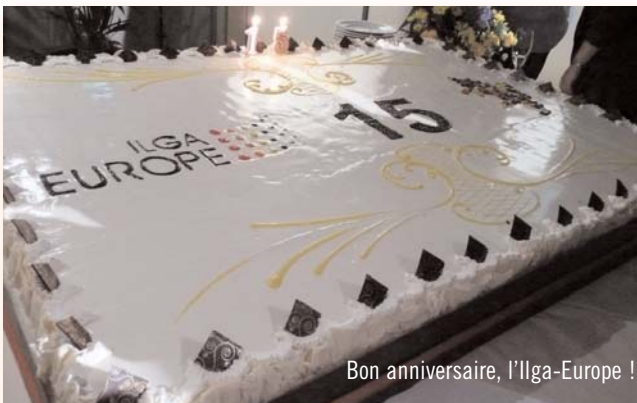
Bon anniversaire, l'Ilga-Europe !

La quinzième conférence annuelle de l'Ilga s'est tenue du 27 au 30 octobre derniers à Turin, en Italie. « Droits humains et valeurs traditionnelles : clash ou dialogue ? », le thème de cette imposante réunion, a permis à nombre de participants, dont le Centre LGBT Paris-ÎdF, de s'exprimer sur la situation actuelle des LGBT en Europe.