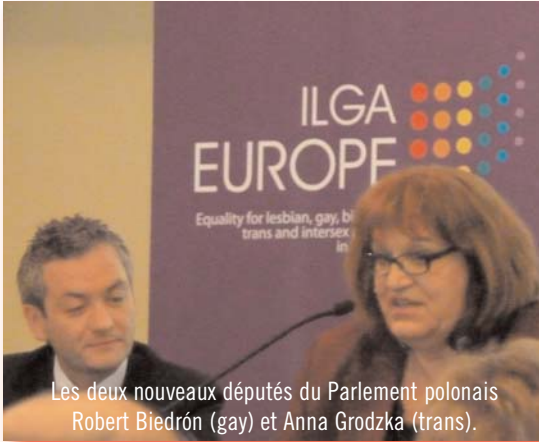
Les deux nouveaux députés du Parlement polonais Robert Biedrón (gay) et Anna Grodzka (trans).